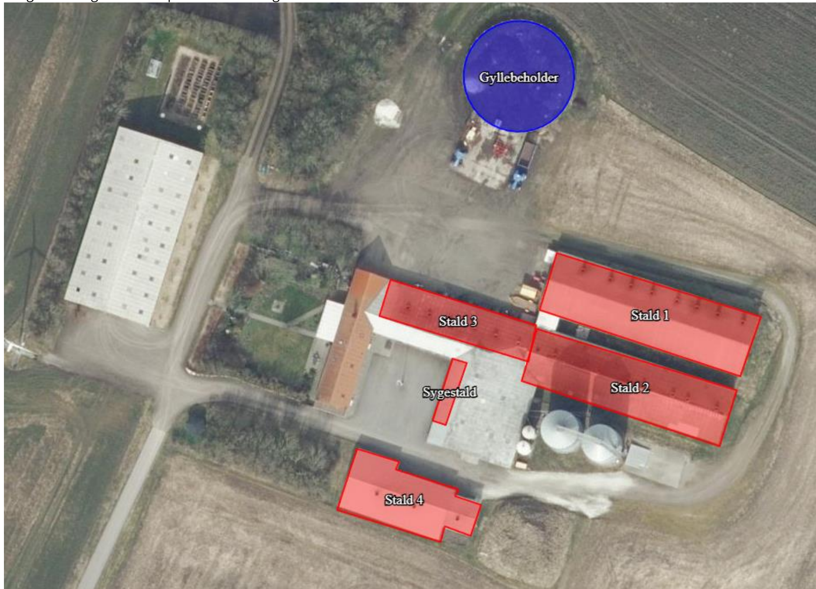
Bilag 2. Oversigtskort over produktionsanlæg